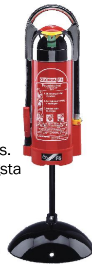
F6 med silvertopp och golvstativ

Den kan också fyllas med alkoholbeständig skumvätska, något som är omöjligt med ordinarie släckare.