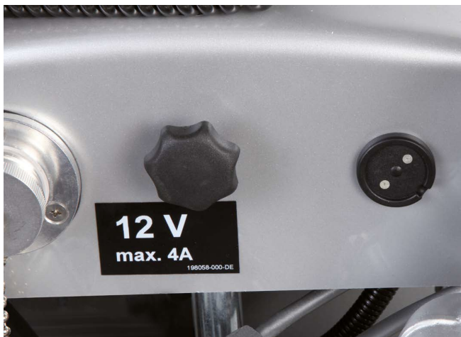
Uttag för externa komponenter, t ex belysning till vagn