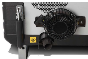
Smart backupfunktion säkerställer drift vid urladdat batteri