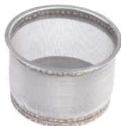
Avgasslag för bortforsling av avgaser, samt skyddssil vi påfyllning av bränsle.