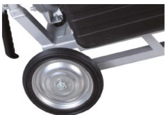
Praktiska hjul underlättar transport av pumpen.

Pumpen kan också förses med en manuell startanordning som kan användas om batteriet är urladdat.