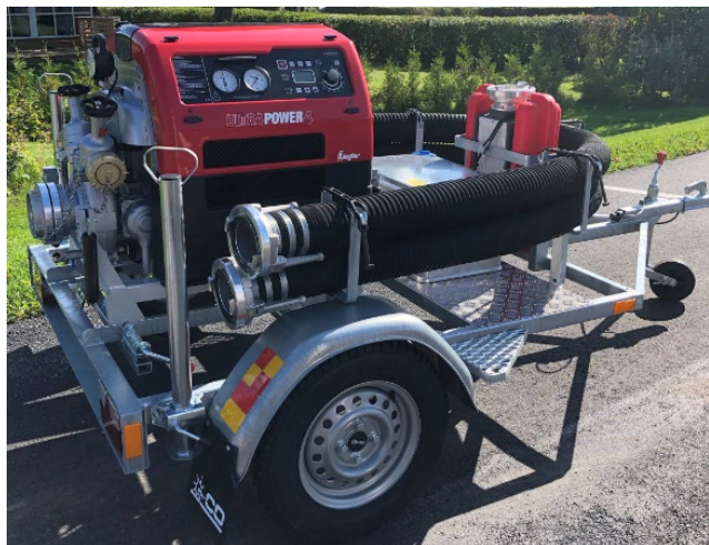
Smidigt släp med plats för både pump, sugslangar och andra tillbehör.