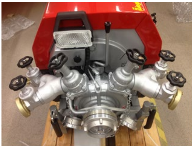
Pumpen kan kompletteras med upp till 4 uttag.