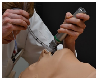
Övningsdocka med realistiska luftvägsfunktioner.

Modellen HLR/AED/Intubation levereras med luftvägar för övning av intubation. Dockan har både oral och nasal intubationsmöjlighet.