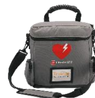
Övningsmaskin med väska