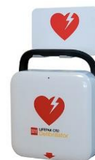
Hjärtstartare med handtag och väggfäste