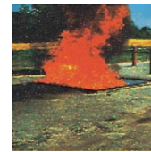
B - Vätskor och material som trä, plaster som tyg och papper bensin och olja