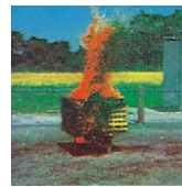
A - Fibrösa

Pulver är det mest mångsidiga släckmedlet och det släckmedel som har högst släckeffekt. Det ger ett utmärkt skydd och är det enda släckmedel som är klassat för samtliga brandtyper: