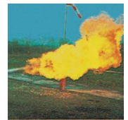
C - Gaser t.ex stadsgas, gasol

Släckarna kan användas mot elektrisk utrustning, släckmedlet inte leder ström. Släckarna är köldbeständiga och kan placeras utomhus även vintertid.