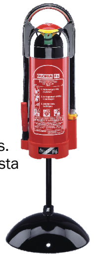
F6 med silvertopp och golvstativ

Den kan också fyllas med alkoholbeständig skumvätska, något som är omöjligt med ordinarie släckare.