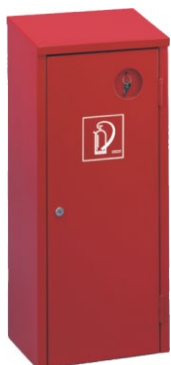
Plåtskåp med nyckellås

Ett komplett program varsel- och utrymningskyltar. Begär separat prospekt och prislista.