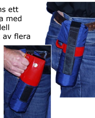
Bälteshölster till 1 kg släckaren

Till 1 kg släckaren finns ett hölster för att lätt bära med släckaren. Denna modell används blanda annat av flera polisdistrikt i landet.