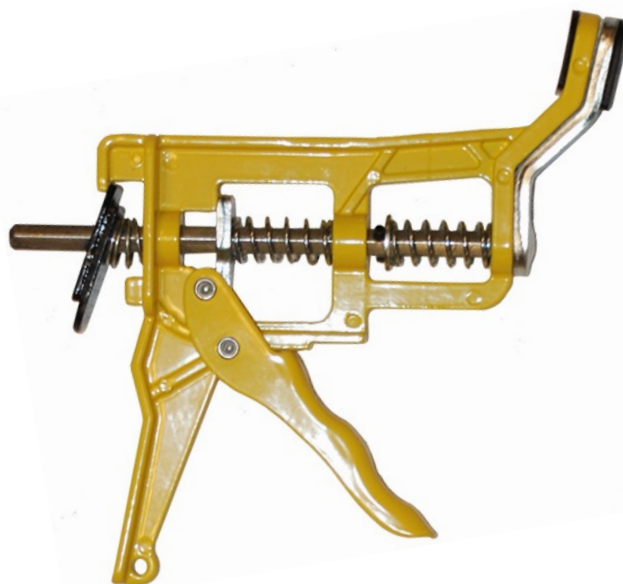
Sprinklertång Gula modellen