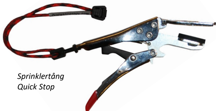
Sprinklertång Quick Stop