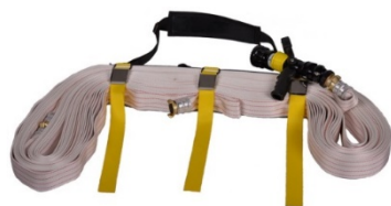
Slangsele, art nr 23-9050-00

Risken att slangselele fastnar mellan vägg, trapp och trappräcke vid trycksättning minimeras, eftersom större delen av slangselele ligger färdigbunkrad på våningsplanet med den här metoden.