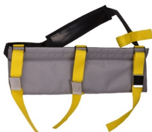
Slangsele visad utan slang

JTpac är en robust och oöm slangselele anpassad för 1-2 42 mm smalslang, med en total längd om 25-50 meter.