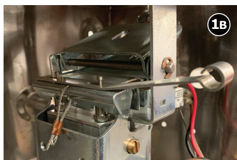
Bild 1B visar montering av säkringspinn i äldre system där platt sprint används. Där monteras säkringspinnen i de 2 hålen.

Bild 1A visar ett nyare system där en rund säkringspinn används. Tryck in pinnen så långt det går genom hålet.