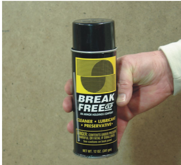
Break Free CLP-12, art.nr 24-5001-55