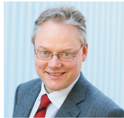
Rådgivning och information är några av de viktigaste uppgifterna vi på Dafo har för att minska risken för bränder. Hur kan vi hjälpa till?