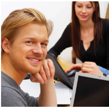
Utbildning är en mycket viktig del av brandskyddet. En grundläggande brandskyddsutbildning gör att personalen blir medveten, säker och handlingsberedd.