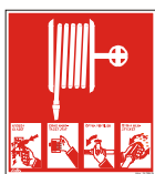
Brandpost med instruktion