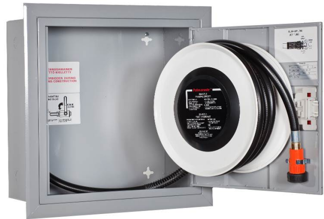
Bilden visar infällt skåp med 20 meter gummislang 19 mm, artikelnummer 19-5316-12

Skåpet är som standard vitt, men kan mot specialbeställning erhållas i annan färg